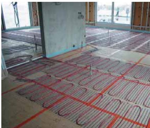
Installation d'un plancher rayonnant avant le coulage de la chape en béton.